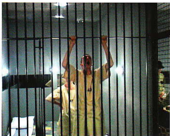
© Artur Żmijewski, Zachęta National Gallery of Art, Warsaw