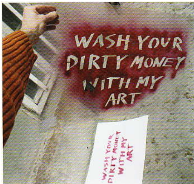
János Sugár, streetartová šablona / street art stencil, 2008