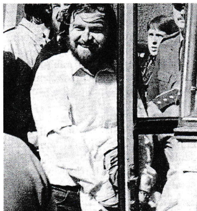
V POUTECH Wonku převážejí od soudu.

ho nechali otevřené a z cely se stala větrací štola. Průvan mi rozdíral klouby, trpěl jsem nesnesitelnými revmatickými bolestmi v kyčlích a kolenou. Ve dne mně nohy ztuhly a zmodraly, dostával jsem křeče a ztratil v nich hybnost,“ hájí se v září 1987 u okresního soudu v Liberci.